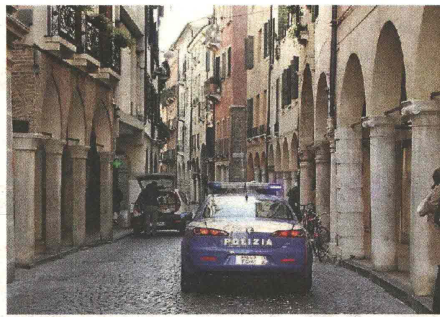
SICUREZZA Pattuglia della polizia lungo Calmaggione

Conegliano Controlli anti baby gang fuori dalle scuole