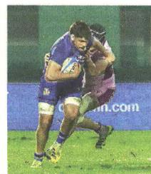
ESORDIO AMARO Per gli azzurrini al Sei Nazioni Under 20